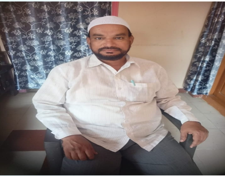
ప్రజా గొంతుక న్యూస్ (పాపన్నపేట)