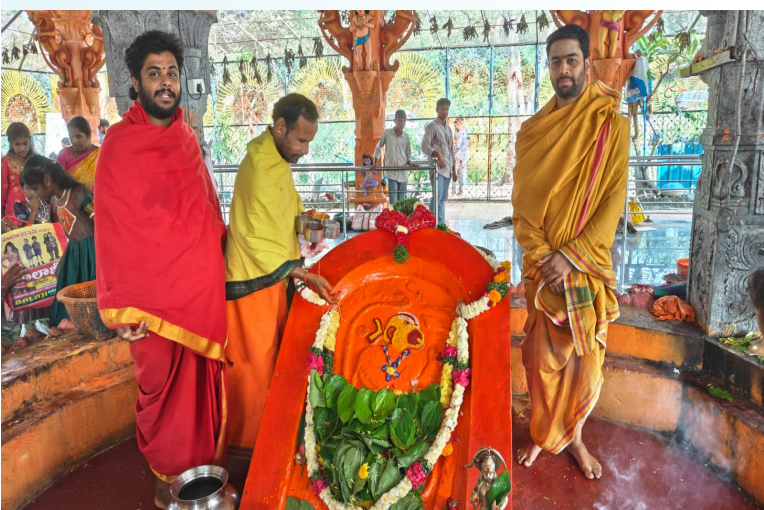
హనుమాన్ నామస్మరణతో మారుమోగిన పరిసర ప్రాంతాలు. శివంపేట. ప్రజా గొంతుక న్యూస్, నవంబర్ 09 :

మెదక్ జిల్లా శివంపేట మండలం చిన్న గొట్టిముక్కుల గ్రామ సమీపంలోని గల చాకలి మెట్ల ప్రసిద్ధ పుణ్యక్షేత్రమైన శ్రీ సహకార ఆంజనేయ స్వామి దేవాలయంలో కార్తీక మాసం శనివారం పర్వదినం సందర్భంగా భక్తులు సామాజిక సత్సనారాయణ ప్రతాలను, ఆంజనేయ స్వామికి ప్రత్యేక పూజలు తో పాటు, అభిషేకాలను నిర్వహించిన భక్తులు, ఆలయానికి విచ్చేసిన భక్తజన సందేహానికి భక్తులకు ఎలాంటి అసౌకర్యం కలగకుండా ఆలయ శ్రస్థ ఆధ్వర్యంలో భక్తులకు ప్రత్యేక ఏర్పాట్లను చేయడం జరిగింది. ఆలయానికి వచ్చే భక్తులకు తీర్థ ప్రసాదాలను అందజేసిన ఆలయ పూజారులు, భక్తులు అన్న వితరణ కార్యక్రమంలో పాల్గొన్నారు.