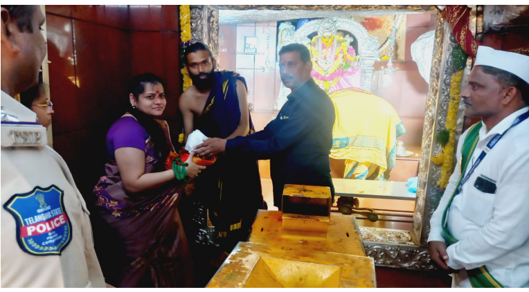
ప్రజా గొంతుక న్యూస్ (పాపన్నపేట)

శనివారం రోజున మెదక్ జిల్లా జ్యూడీషియల్ జెడ్డె సిరి సౌజన్య శ్రీ ఏడుపాయల వన దుర్గ భవాని అమ్మవారిని దర్శించుకున్నారు. వీరికి పూర్వంభంతో ఆలయ అర్చకులు ఘనంగా స్వాగతం పలికారు, ప్రత్యేక పూజలు నిర్వహించి తీర్థ ప్రసాదాలు అందజేశారు వీరి వెంట పోలీస్ సిబ్బంది మరియు దేవస్థానం సిబ్బంది ఈ కార్యక్రమంలో పాల్గొన్నారు.