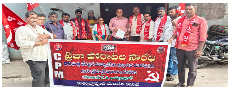
కుత్బుల్లాపూర్ ప్రజా గొంతుక