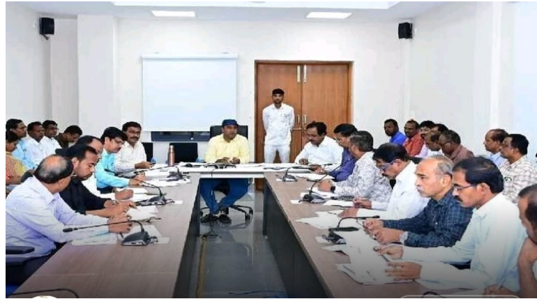
శివంపేట. ప్రజా గొంతుక న్యూస్, నవంబర్ 09:

మెదక్ జిల్లా కలెక్టర్ కార్యాలయంలో సమగ్ర ఇంటింటి కుటుంబ సర్వే నిర్వహణలో భాగంగా అధికారులతో జిల్లా కలెక్టర్ రాహుల్ రోజ్ సమావేశం నిర్వహించారు. ఈ సందర్భంగా కలెక్టర్ మాట్లాడుతూ సర్వే కొరకు జారీ చేసిన పుస్తకంలో మొత్తం 56 అంశాలు ఉంటాయని ఎలాంటి అనుమానాలు సందేహాలకు తావు లేకుండా ప్రజల నుంచి ఖచ్చితమైన సమాచార సేకరణతో సమాధి చేయాలని సూచించారు. సమావేశంలో కలెక్టర్ తో పాటు అదనపు కలెక్టర్ వివిధ శాఖల అధికారులు తదితరులు పాల్గొన్నారు.