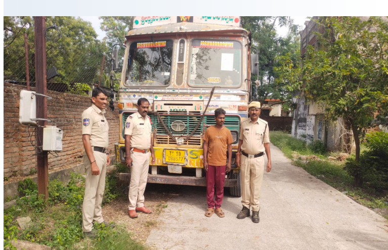
ప్రజా గొంతుక నెక్కొండ ప్రతినిధి