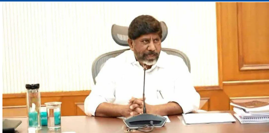
ప్రజా గొంతుక డెస్క్ వికారాబాద్ జిల్లా లగవర్ర ఫుటనను దివ్యులీ సీఎం భట్టి విక్రమార్కు ఖండించారు. అధికారులపై దాడి చేయడం వెనుకీ తగ్గుతాం అనుకుంటున్నారా?, కేసీఆర్, ఉండన్నారు.

కేసీఆర్, హరీశ్ రావు తలకిందులుగా తపస్సు చేసినా ఈ ప్రభుత్వాన్ని అస్థిరపరచలేరన్నారు. అభివృద్ధి తమ లక్ష్యం అని చెప్పారు. దాడికి పాల్పడిన వారు ఎంతటి వారైనా వారిని వదిలే ప్రసక్తి లేదని హెచ్చరించారు. సచివాలయంలో నేడు ఆయన మీడియాతో మాట్లాడుతూ, ఉద్యమ సమయంలో ప్రజలను రెచ్చగొట్టి ప్రాణాలు కోల్పోయేలా చేసిన బీఆర్ఎస్ ఇప్పుడు వారి స్వార్థం కోసం అమాధుల ప్రజలను రెచ్చగొడుతున్నారని ఆగ్రహం వ్యక్తం చేశారు. కావాలనే కుట్రపూరితంగా కలెక్టర్ పై బీఆర్ఎస్ శ్రేణులు దాడికి పాల్పడ్డాయని భట్టి పై అయ్యారు. అమాయక గిరిజనులను రెచ్చగొట్టి దాడికి ఉసిగొల్పారని దుయ్యబట్టారు. ఇది బాధ్యత కలిగిన ప్రతిపక్షం చేయాల్సిన పని కాదని, తాము ప్రతిపక్షం ఉండగా ఇలా వ్యవహరించలేదన్నారు. రాష్ట్రంలో పరిశ్రమలు రావడం బీఆర్ఎస్ కు ఇష్టం లేదా అని నిలదీశారు. కలెక్టర్ పై దాడిని కేసీఆర్ సమర్థిస్తున్నారా? అని ప్రశ్నించారు. దాడులు సమస్యలకు పరిష్కారం కాదని ఏదైనా అభ్యంతరం ఉంటే అధికారులతో చర్చించి పరిష్కరించుకోవాలన్నారు. ఇందిరమ్మ రాజ్యంలో భావవ్యక్తికరణ స్వేచ్ఛం