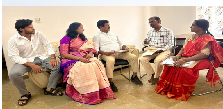
వలిగొండ నవంబర్ 13 ప్రజా గొంతుక ప్రతినిధి