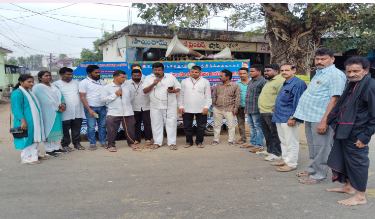
ప్రజా గొంతుకు ప్రతినిధి/దుమ్మగూడెం: