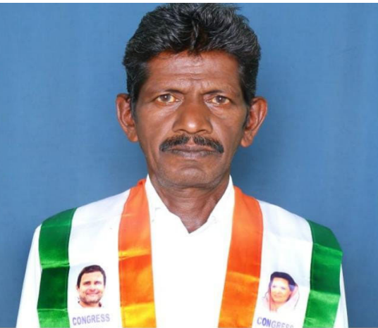
మన ప్రయోజనం, తెలుగు ప్రజల ప్రయోజనం, మన దేశం ప్రయోజనం