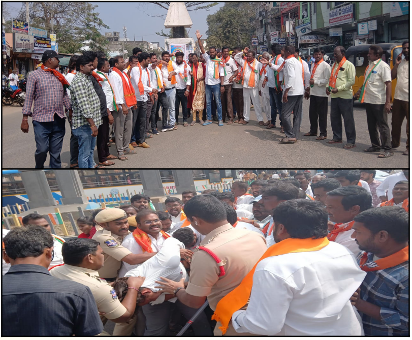
నర్సంపేట పట్టణ కేంద్రంలోని అనుపవీరుల స్థూపం దగ్గర భారతీయ జనతా పార్టీ నాయకులు మొండి వైఖరితో, అసమర్థ పాలనతో నిన్ను కేంద్ర హెంకా సహాయక శాఖ మంత్రివర్యులు, భారతీయ జనతా పార్టీ నాయకులు బండి సంజయ్ కుమార్ గారి దిష్టిబొమ్మను దహనం చెయ్యగ దాని నిరసిస్తూ వారి మొండి వైఖరిని ఎండగడుతూ ఈరోజు నిరసన వ్యక్తం చేసి అలాగే కాంగ్రెస్ పార్టీ సీఎం రేవంత్ రెడ్డి దిష్టిబొమ్మను దహనం చేయడం జరిగింది.