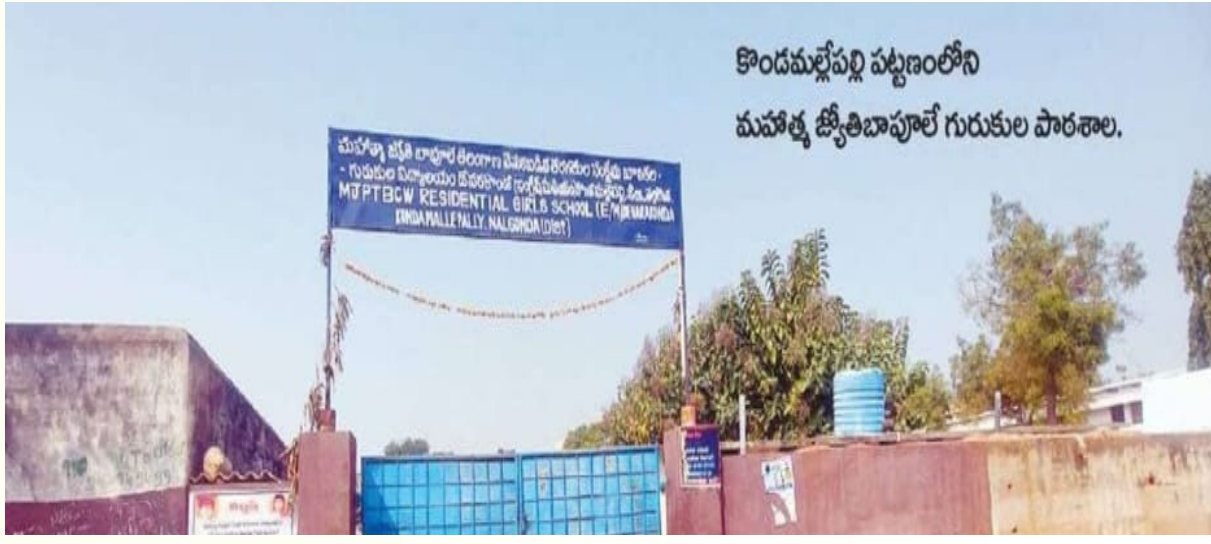
కాండమల్లేపల్లి పట్టణంలోని మహాత్మా జ్యోతిబాపూలే గురుకుల పాఠశాల.