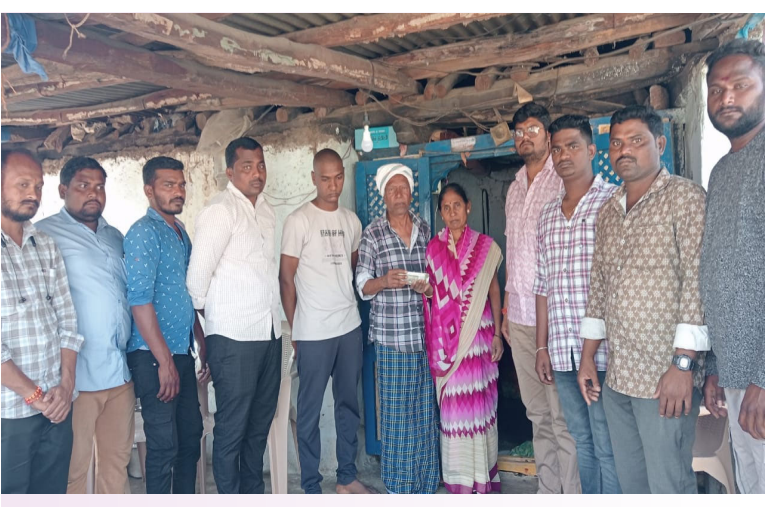
మృతుని కుటుంబానికి ఆర్థిక సహాయం