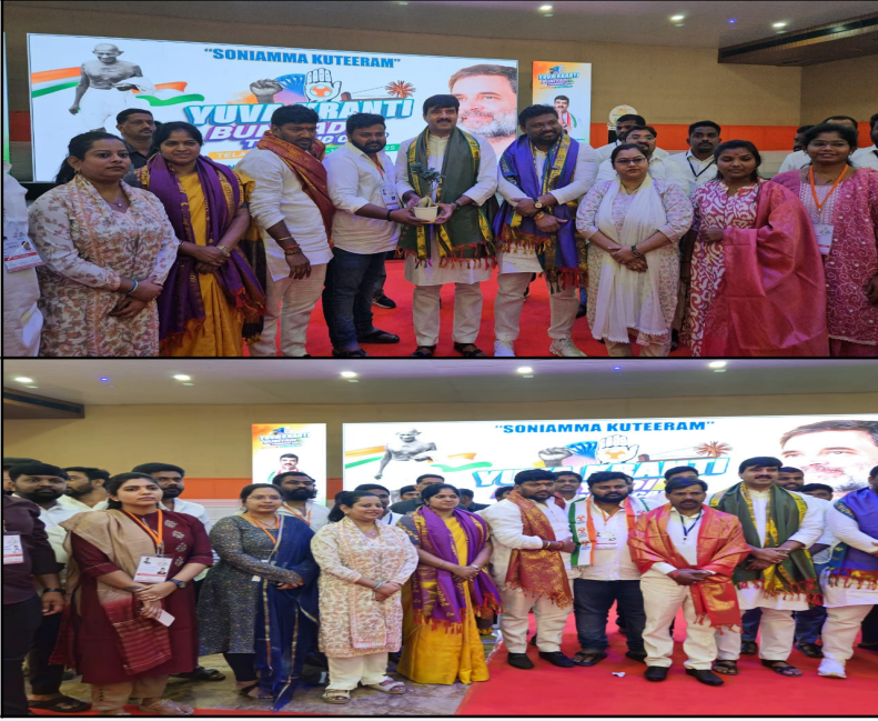
ప్రజా ప్రభుత్వం అమలు చేస్తున్న ప్రతి పథకాన్ని ప్రజలకు వివరిస్తూ అందిస్తూ పార్టీ బలోపేతానికి కృషి చేయాలని తెలిపారు... ప్రతి ఒక్క యువజన కాంగ్రెస్ నాయకులు కార్యకర్తలు, తమ తమ జిల్లాల్లో నియోజకవర్గాల్లో క్రమ శిక్షణతో మెదులుకోవాలని సూచించారు...