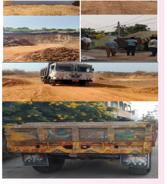
ఇప్పటికైనా అధికార యంత్రాంగం చర్యలు తీసుకోవాలని స్థానికులు కోరుతున్నారు.

ప్రజా గొంతుక న్యూస్ హుజూర్ నగర్ హుజూర్ నగర్ నియోజకవర్గంలో ఇసుక, మట్టి, అక్రమ రవాణా ఇష్టాకాంక్షగా సాగుతోంది. కొందరు అధికార పార్టీ నాయకులకు అక్రమ సంపాదన కు మట్టి, ఇసుక మార్గమైంది. హుజూర్ నగర్ మండలం లోని వేములూరి వాగు పరిపాలనా ప్రాంతంలోని శ్రీనివాస్ పురం, లింగగిరి, సర్కారు గ్రామాలలో ఇసుక తవ్వకాలు జరిపి ట్రాక్టర్ల ద్వారా హుజూర్ నగర్ మున్సిపాలిటీ పరిధి లోని సీసీ రోడ్ల నిర్మాణం కోసమని బూటకపు మాటలు చెప్పుకుంటూ ప్రైవేటు వెంచర్లకు, నిర్మాణాలకు ఇతరులకు తరలిస్తూ దంపింగ్ చేసి మరీ అమ్ముకాలు చేస్తూ ఇసుక మాఫియా లక్షలాది రూపాయల ప్రభుత్వ సొమ్ము దోచుకుంటున్నారు. వేములూరి వాగు నుండి సుమారు సంవత్సర కాలంగా ఇష్టానుసారంగా ఇసుక అక్రమ రవాణా జరుగుతున్నా అధికార యంత్రాంగం చూసి చూడనట్లు వ్యవహరిస్తుంది. ట్రాక్టర్లలోకి దిగి ప్రాంతంలోకి ఎడ్లబళ్ళు, ఆలోలను దించి వాటి ద్వారా ఇసుకను నిల్వ చేసి రాత్రి వేళల్లో ట్రాక్టర్ల ద్వారా అమ్ముకాలు జరిపి ఇసుకాసురులు వేలాది రూపాయలు సొమ్ము చేసుకుంటున్నారు. బైపాస్ రోడ్ లకు మట్టి పేరుతో రామస్వామి గట్టు వద్ద, ఎర్రగట్టు శివారు లలో భారీ కండకాలు పెడుతూ భారీ ట్రైపుర్లతో నూతన వెంచర్లకు మరియు నూతన రైస్ మిల్ నిర్మాణాలకు అమ్ముకాలు చేస్తూ ప్రజా ధనాన్ని దోచుకుంటున్నారని ఇతర జరుగుతున్నా ఇసుక అక్రమ రవాణాపై, మట్టి మాఫియా పై మొక్కుబడిగా తనిఖీలు చేసి చేతులు దులుపుకుంటున్నారు. ఇప్పటికైనా అధికార యంత్రాంగం చర్యలు తీసుకోవాలని స్థానికులు కోరుతున్నారు.