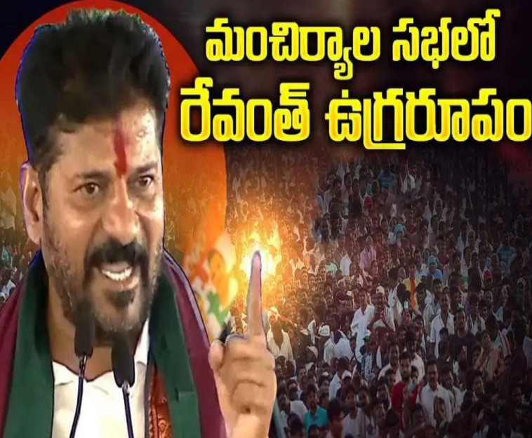
మంచినీటి సభలో రేవంత్ ఉగ్రరూపం